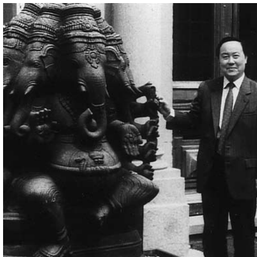
Ganesha am Völkerkundemuseum, 1988