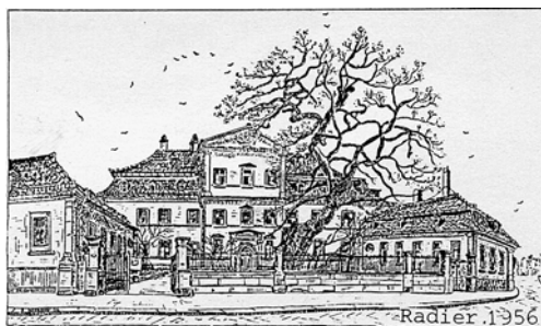
Völkerkundemuseum, Hauptstr. 235, Heidelberg