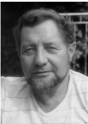
So möchte er auch in Erinnerung bleiben, meinte er. (Foto ca. 1987)