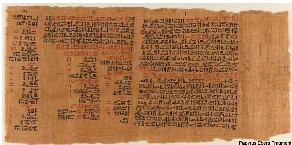
Papyrus Ebers Fragment